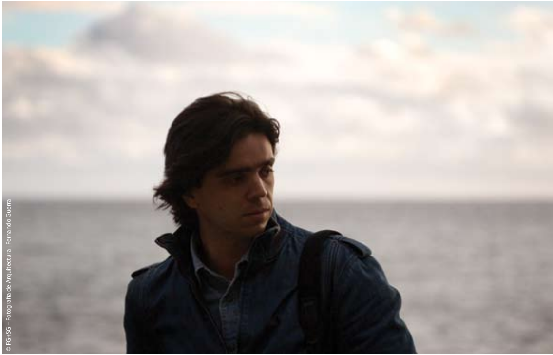
© FG-50 - Fotografia de Arquitectura | Fernando Guerra

CP Imagino que se é influenciado, em maior ou em menor medida, por tudo aquilo a que nos expomos.